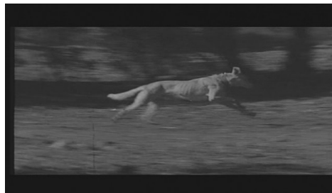
1. El perro atacando el ciervo. Uno de los planos en clara alusión al mito. Redundancia dentro del mito –repetición de este plano- así como redundancia del relato concreto a nivel general encarnándose a través de la repetición del audio en off de las máquinas recreativas..

Estilización a favor de un simbolismo tamizado por el mito que se sitúa en el polo opuesto del film de Saura. Del realismo behaviorista pasamos a una realidad pasada por el filtro de la hermenéutica. No realidades externas al individuo, realidad como hecho social acogiéndonos a la terminología del sociólogo Emile Durkheim, sino el fenómeno interpretativo de la misma. Realidades distorsionadas por la focalización de un personaje interpretado por Martín Lasalle –representado a lo largo de la película por los distintos reflejos en cristales, espejos y escaparates-, y explicadas a través de elementos mitológicos –constantes referencias a los ciervos así como el audio en off de las jaurías de perros y del narrador del mito-.