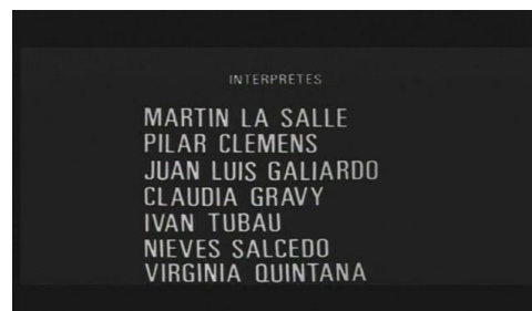
3. Títulos de crédito finales.

Dos niveles diferenciados en esta sencilla introducción donde se condensa la dinámica del film. El relato concreto de un pescador sin nombre, resaltando esta ausencia nominativa de lo particular a través de los títulos de crédito: solo el nombre de los actores, no el de los personajes. Siguiendo la filmografía de Jorge Grau, este reclamo a lo universal es la culminación de una evolución en lo que a la distribución de personajes en el film se refiere. En su debut Noche de verano , 1962, lo que dominaba era “el tono colectivo y hasta cierto punto coral.” 7 Es en El espontáneo , 1964 donde el relato gira entorno a un personaje quedando patente en los títulos de crédito “un solo nombre propio, el de Paco: denominaciones genéricas para el resto.” 8 Esta traslación en sus dos filmes anteriores: tono colectivo → tono individual, se completa con Acteon a un nuevo terreno: tono universal. Nuevamente los títulos de crédito dan cuenta de las intenciones de Grau al respecto. No existen nombres propios para ninguno de los protagonistas, tampoco para el principal. Tan solo el título del film. Título que los créditos no lo identifican con Martín La Salle quedando simplificados a una somera transcripción del nombre de los actores. Tampoco hay personajes genéricos como es el caso de El espontáneo . Se sacrifica lo concreto a favor del mito: ACTEON, único nombre propio.